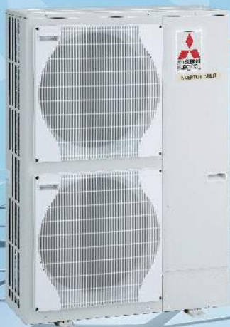
MXZ-6A112VA MXZ-7A140VA MXZ-8A160VA